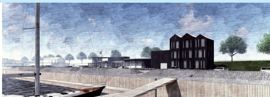
Schierzicht Logement, het hotel in de haven van Lauwersoog, is een ontwerp van Architectenbureau Adema uit Dokkum. De verwachting is dat de bouw begin april start.