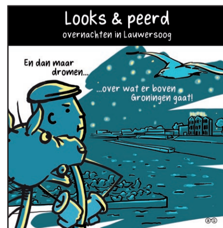
Illustratie: Reinier van den Berg en Hans Broekhuis

binnenkort een nieuwe drijvende steiger in de haven te liggen. Deze is heel specifiek voor de off-shore industrie bestemd. Op de foto is één onderdeel van de nieuwe steiger te zien. In totaal komen er drie van deze elementen. Als de drijvende steiger klaar is kunnen er wel 15 crewtenders liggen die vanuit de haven onderhoud verrichten aan offshore windparken.